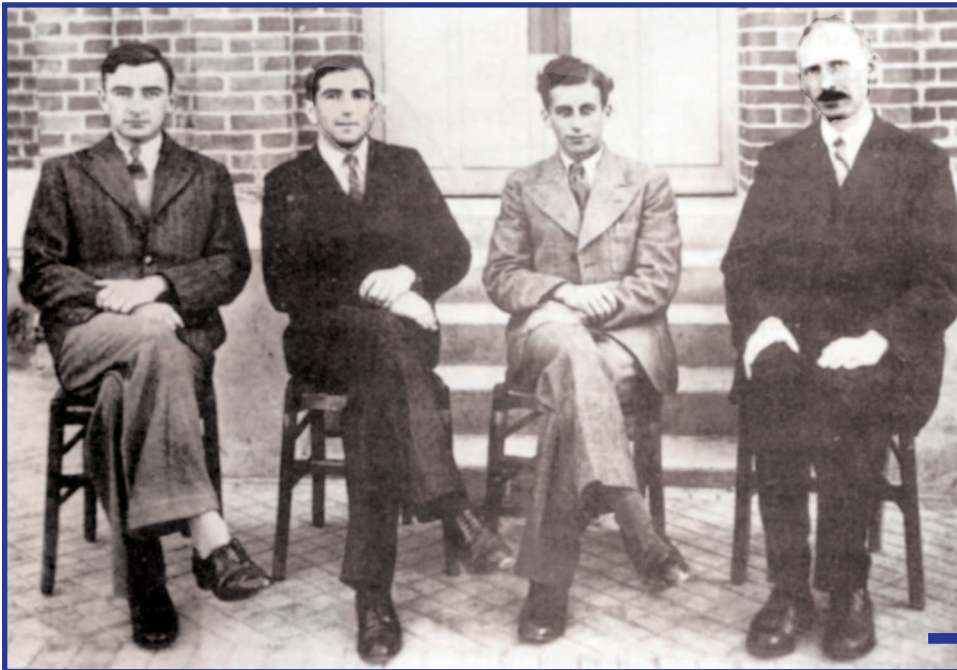
Équipe pédagogique de l'école du Bois Saint-Denis, - année 1933-1934.-